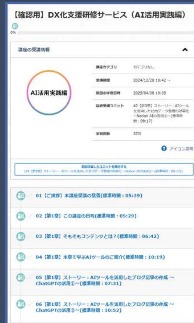
プラットフォームイメージ